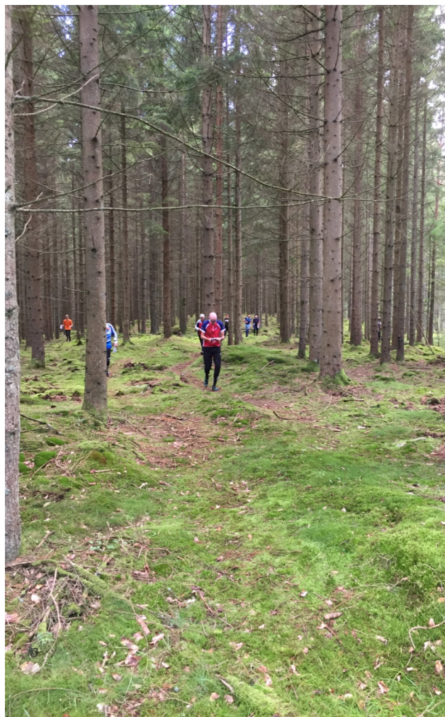
Vi hoppas på barmark i april!

Samlingsplatsen kommer att vara en av betesåkrarna norr om klubbstugan. Alla är välkomna att hjälpa till både under själva tävlingsdagen och med förberedelserna veckan innan. Ta gärna kontakt med tävlingssektionen så får du veta mer om vad just du kan hjälpa till med.