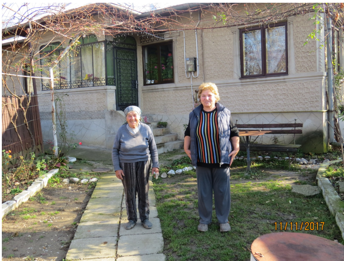
Och så ett par rumänska damer, som inte hade något emot att bli fotograferade.