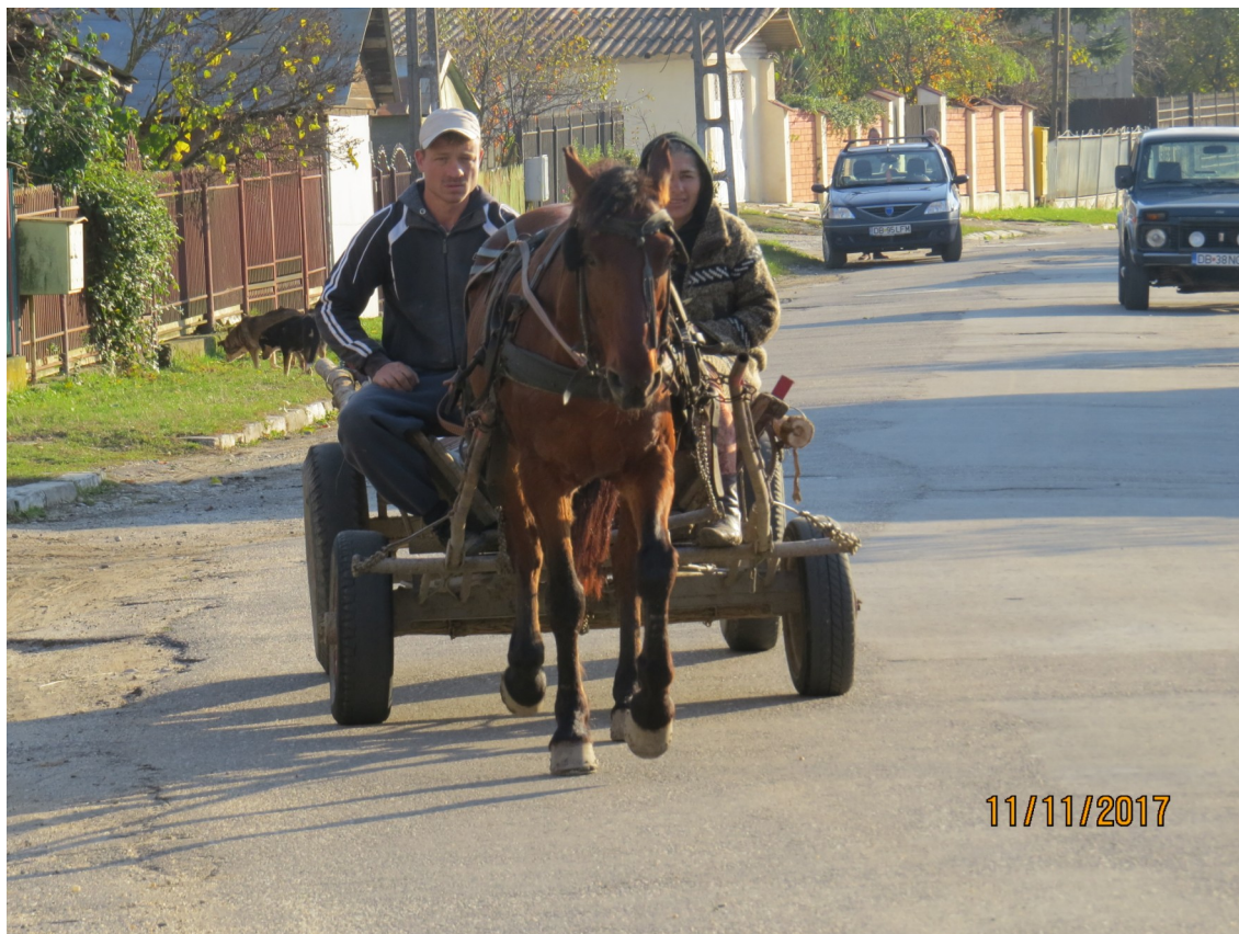
Häst och vagn som jag sett på många bilder från Rumänien, nu fick jag se det i verkligheten.