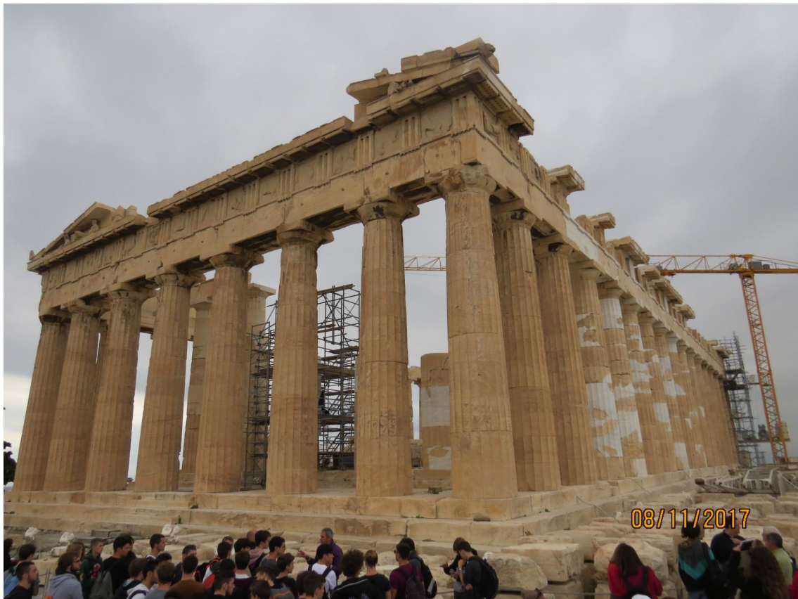
Aten och ett Akropolis under renovering