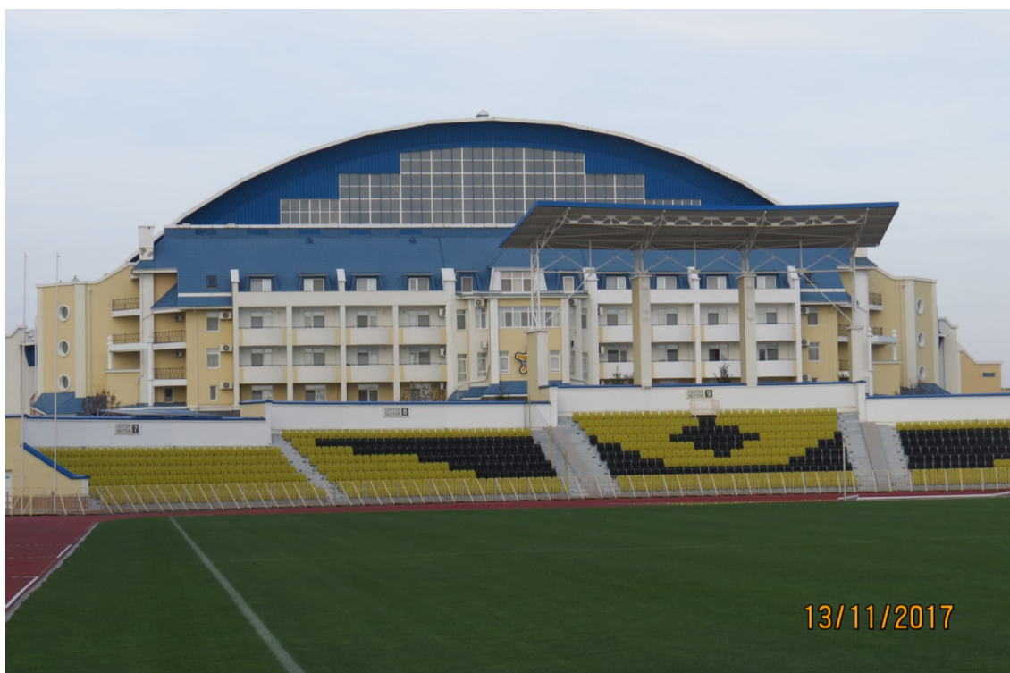
Till slut en bild från fotbollsstadion i Transnistrien, utbrytarrepubliken från Moldavien som beskrivs som Europas mest slutna land. Här ser mycket väldigt fattigt ut, men det finns undantag... Det var även här som Karl XII slogs i det som kom att kallas Kalabaliken i Bender.