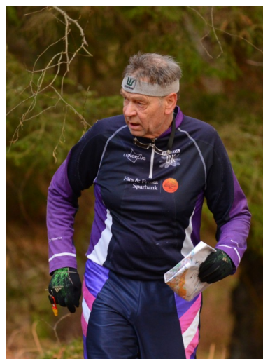
Ordförande med fokus i blicken under 2017 års danska Jättemil.