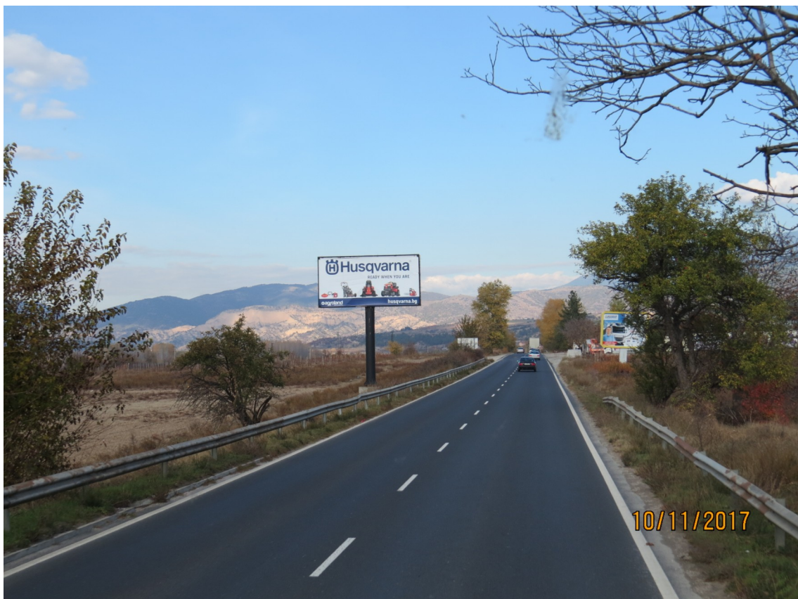
Är det Småland? Nej, det är ju bara en reklamskylt i Bulgarien.