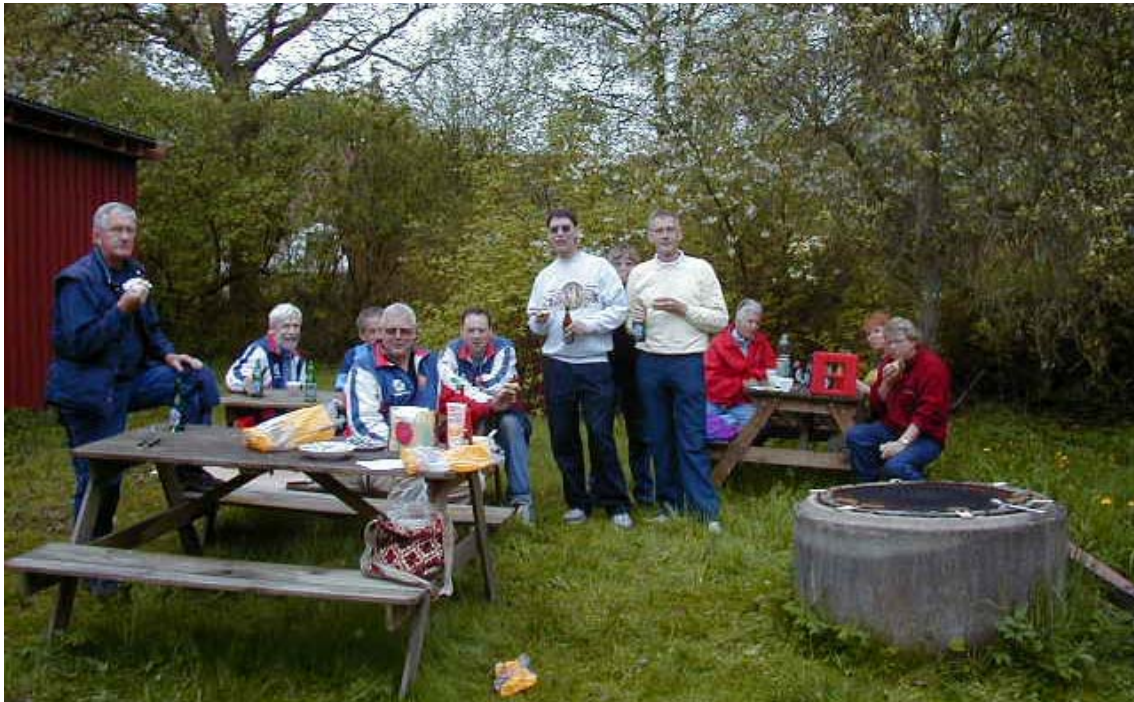
Grillat efter väl förrättat värv!