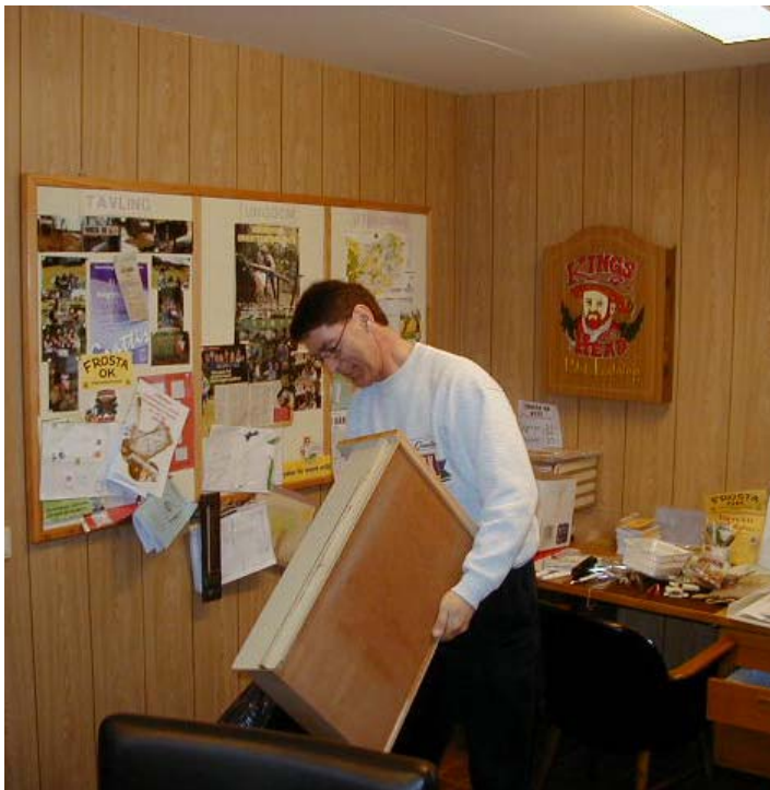
Märkning av lådor

Ett stort tack till alla klubbmedlemmar som ställde upp på Lyckebo den 8 maj!