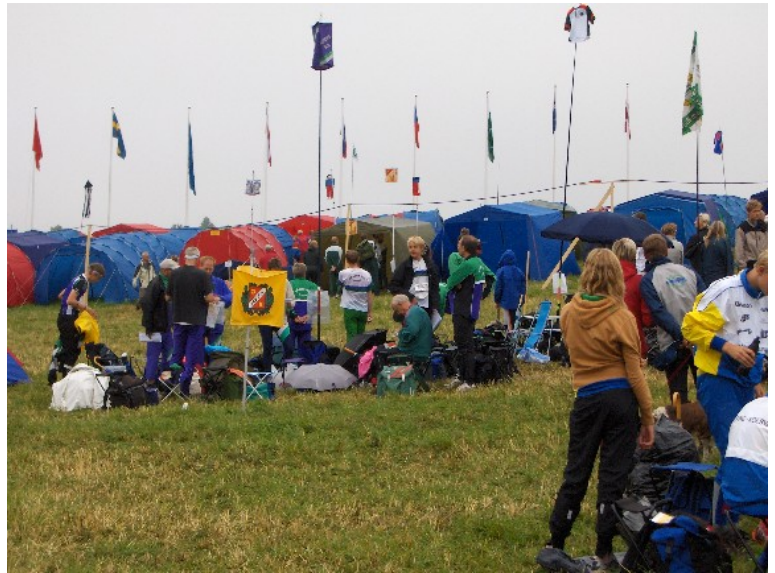
Etapperna bjöd på växlande terräng, allt ifrån Taberg-höjderna till snabblopt tallhed. Vädret var även det omväxlande, allt ifrån regn till solsken och allt där emellan