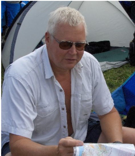
Rune kunde inte hålla sig ifrån ett femdagars!